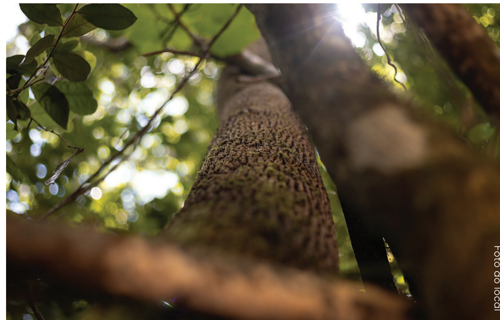
Foto do local