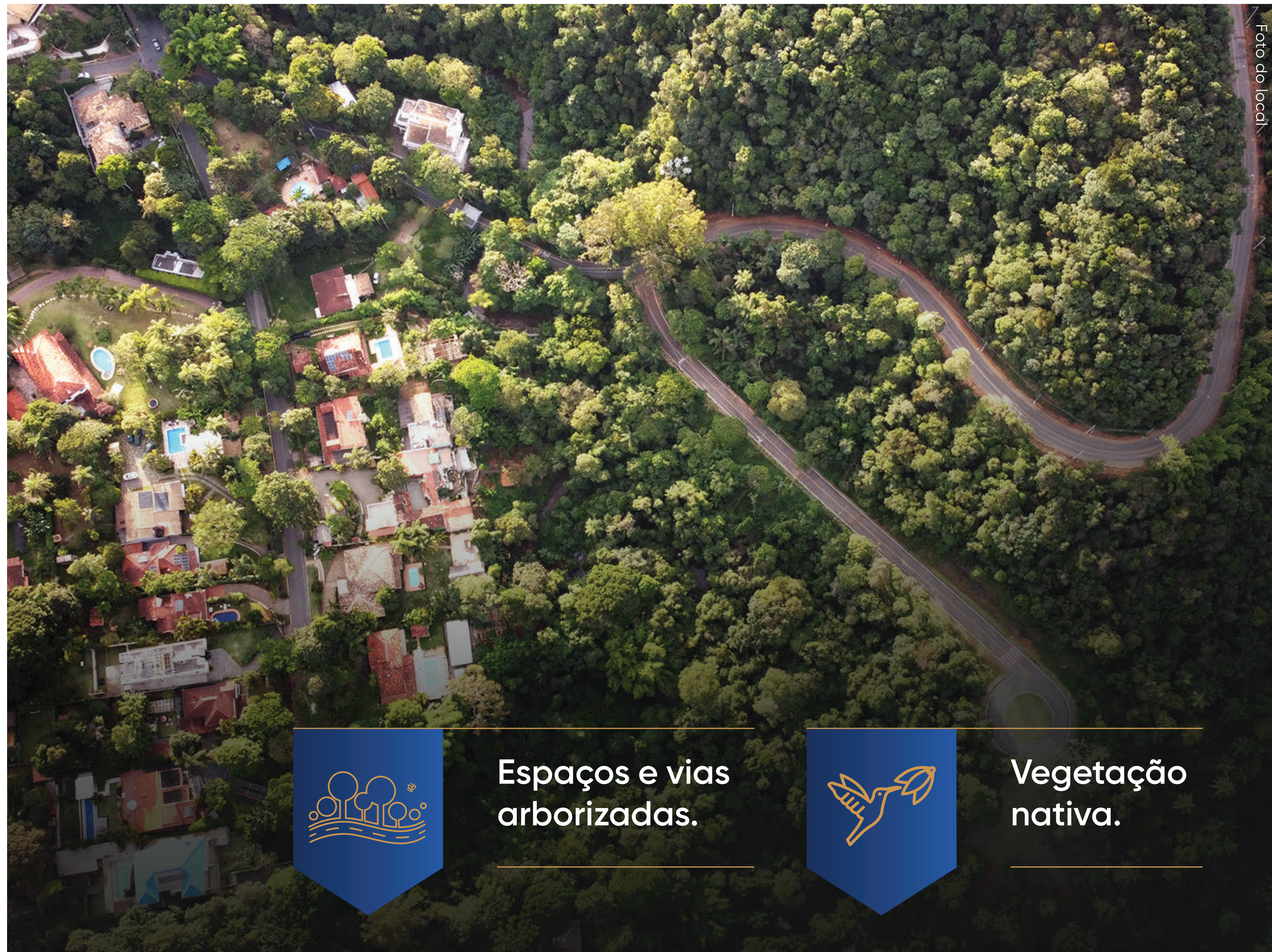
Foto do local